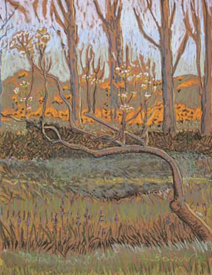
links Pauline Bewick Perenboom 2006, pastel, 83,2 x 62,4 cm